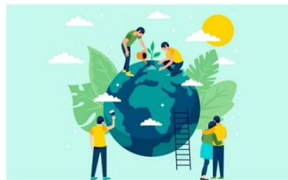
Commission - Conversion Ecologique