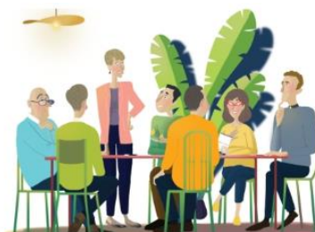
Commission - Vie du mouvement