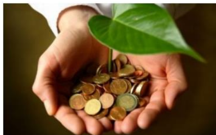
Commission - Economie et Finance Ethiques