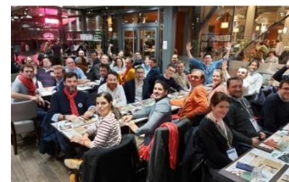
Commission - Jeunes EDC (JEDC)