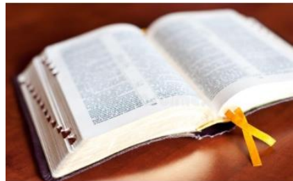
Commission - Sources bibliques et theologiques