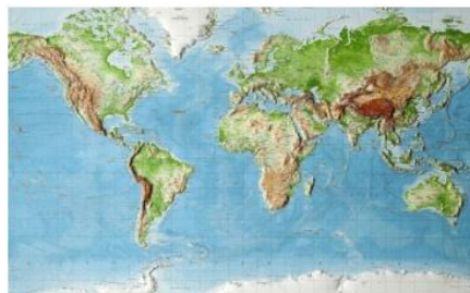
Commission - International