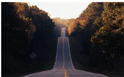
Commission - Reperes