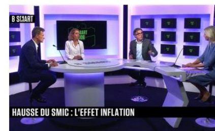
Commission - Communication